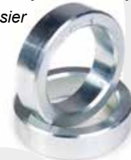
PS7 - PS8